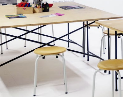
Möchtest du auch etwas gestalten?